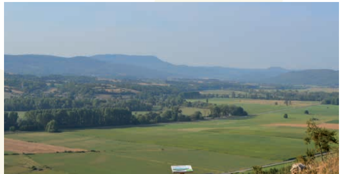
aménagement de l'ENS de la Côte de Moini...