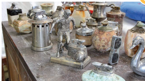
Collection de briquets

Jean-Philippe promène pour nous son appareil photo dans les allées de la ressourcerie. Et nous propose ses clichés !