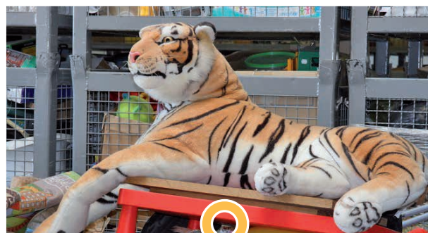
Fauve en attente au chantier...