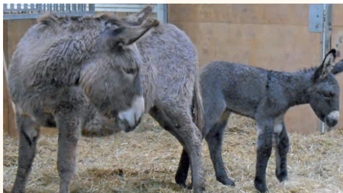
Photo des ânes prise au printemps 2017

Tout ce monde vous attend sur la Côte de Moini. Le site est ouvert au public en faisant preuve de responsabilité : Merci de refermer les portillons inter-clôture derrière vous et de NE PAS NOURRIR LES ANIMAUX . Une caresse reste le met le plus apprécié !