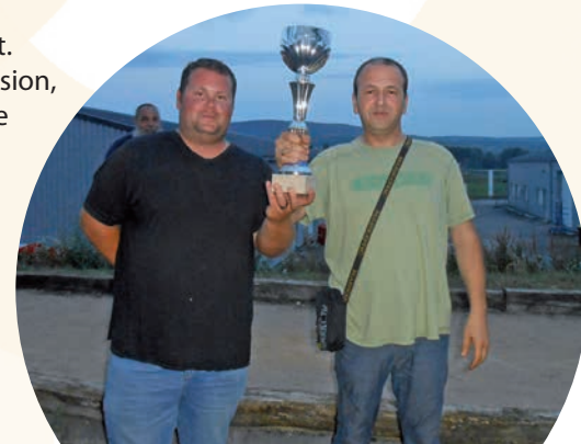
A l'année prochaine !